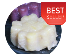
ขนมกล้วย