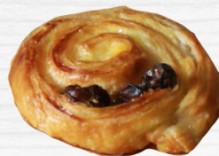
มินิซินนาม่อน