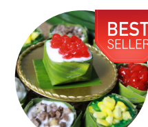
ขนมตะโก้คะหน้า