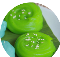
เปี้ยกปูนใบเตย