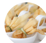
ลูกทองไล่กุ้ง