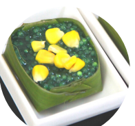
สาकुข้าวโพด