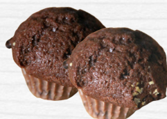
มัฟฟินช็อกโกแลต