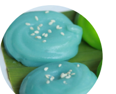
เปี้ยกปูนอัญชัน