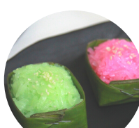
ข้าวเหนียวมูน