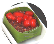
สาकुทับทิมกรอบ