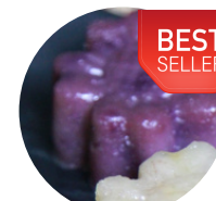
ขนมมันม่วง