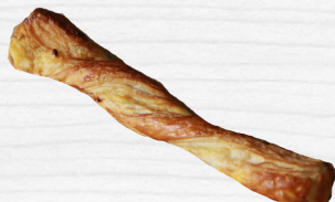
คาราเมลแคชวีนัส