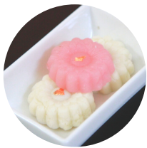
ทองคำขาว + ทอง ชมพู