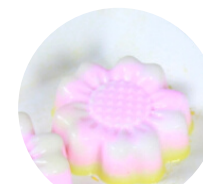
วุ้นดอกไม้