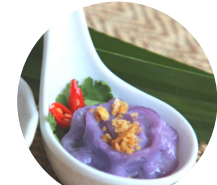
ซอม่วง* (ราคาพิเศษ)