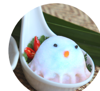
จิ้นนก* (ราคาพิเศษ)