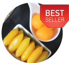
ทองหยอด + เม็ด ขนุน