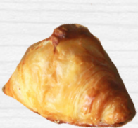
มินิครัวซองต์เนยสด

ขนมปังหอมเนย คล้ายครัวซองต์ กรอบนอก นุ่มใน มีความหนึบ