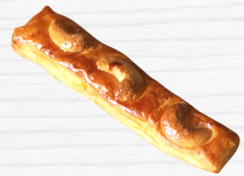
เดนิชเม็ดมะม่วง