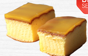
เค้กสี่มุมชีกเนเจอร์