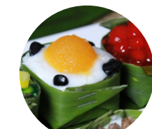
ข้าวเหนียวหน้านวล