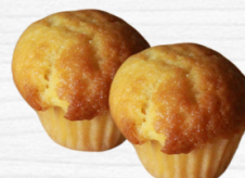
มัฟฟินวานิลลา