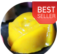
ขนมฝักทอง