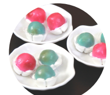
ไล่ไล่ประยูรต์